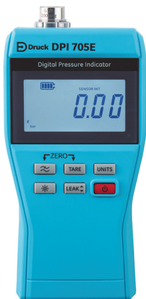
Druckanzeige für sichere Bereiche