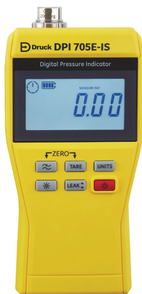
Druckanzeige für Ex-Bereiche

Die portablen Druck- und optionalen Temperaturanzeigen der Druck DPI 705E-Serie vereinen eine stabile und robuste Ausführung mit präzisen und zuverlässigen Messungen.