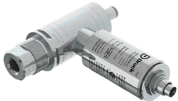
PM 700E (Differenzdruck)