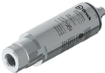
PM700E (Relativ-, Absolutdruck)