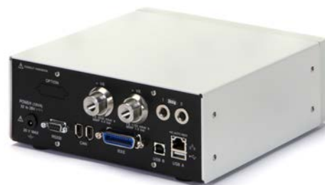
Geräterückseite des PACE1000